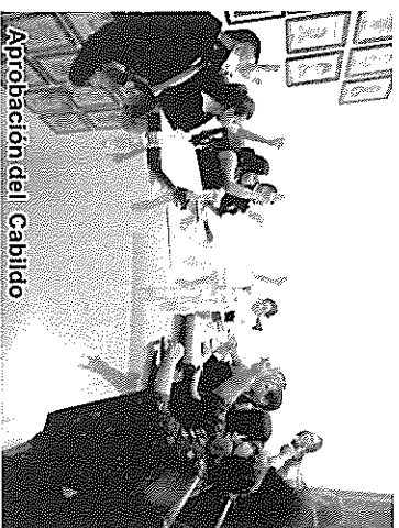
Aprobación del Cabildo

"Con hechos y resultados positivos, hemos demostrado que la ciudadanía como la decisión correcta al brindarnos su confianza y gracias a ello hemos logrado transformar el contexto de oportunidades que se dan todos los días en este municipio", indicó.