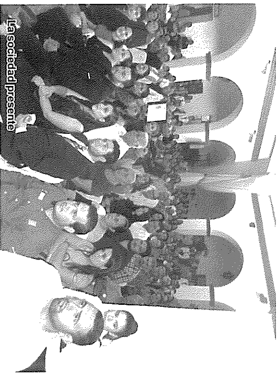
La Sociedad presente

El Sistema DIF Cosalá siempre ha tenido muy claro sus objetivos ocupando los por el bienestar para la familia, principalmente por los niños, niñas, adultos mayores y personas con discapacidad.