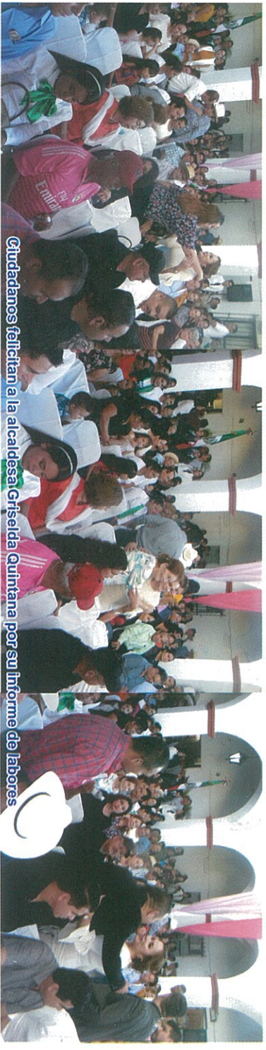
Ciudadanos felicitan a la alcaldesa Griselda Quintana por su Informe de labores

Se entregaron despensas, se realizaron desayunos escolares, se llevó a cabo el programa "Cuatresma en familia. A través del Instituto Nacional de las Personas Adultas Mayores se han entregado credenciales que dan acceso a decenas de beneficios para este sector de la población.