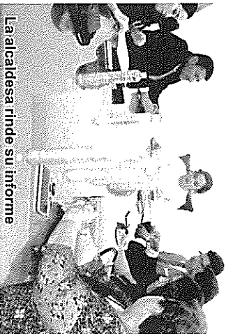
La alcaldesa rinde su informe

+ Compromiso de escuchar y dar respuesta a las necesidades ciudadanas *Trabajamos con honestidad en una política transparente e incluyente